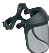
ΜΑΣΚΑ ΠΡΟΣΤΑΣΙΑΣ (με σίτα) ΕΠΑΓΓΕΛΜΑΤΙΚΗ 15,50€ ΕΡΑΣΙΤΕΧΝΙΚΗ 9,99€