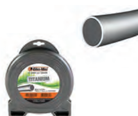
TITANIUM ΣΤΡΟΓΓΥΛΗ Φ3,5mm / 41m BLISTER 16,90€