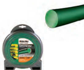
GREENLINE ΣΤΡΟΓΓΥΛΗ Φ3,0mm / 15m BLISTER 5,90€ Φ3,5mm / 12m BLISTER 5,90€ Φ3,0mm / 56m BLISTER 13,90€ Φ3,5mm / 41m BLISTER 13,90€ Φ4,0mm / 31m BLISTER 13,90€