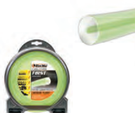
FIRST ΣΤΡΟΓΓΥΛΗ Φ3,0mm / 15m BLISTER 6,50€ Φ3,5mm / 56m BLISTER 16,50€ Φ3,5mm / 41m BLISTER 16,50€ Φ4,0mm / 31m BLISTER 16,50€