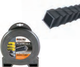
PLATIN CUT ΠΡΙΟΝΩΤΗ Φ3,5mm / 41m BLISTER 18,50€