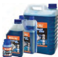
EUROSINT ΣΥΝΘΕΤΙΚΟ ΛΑΔΙ 2Τ 1 lt ΜΕ ΔΟΣΟΜΕΤΡΗΤΗ 17,90€