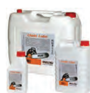
ΒΙΟΔΙΑΣΠΩΜΕΝΟ ΛΑΔΙ ΑΛΥΣΙΔΑΣ 1 lt 7,50€ 5 lt 32,00€ 20 lt 98,00€