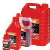
PROSINT ΣΥΝΘΕΤΙΚΟ ΛΑΔΙ 2Τ 100 ml 2,29€ 1 lt ΜΕ ΔΟΣΟΜΕΤΡΗΤΗ 11,90€