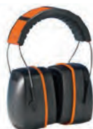
ΩΤΟΑΣΠΙΔΕΣ ΚΗΠΟΥ ΕΠΑΓΓΕΛΜΑΤΙΚΕΣ (32dB) 47,90€ ΕΠΑΓΓΕΛΜΑΤΙΚΕΣ (30dB) 25,90€ ΕΡΑΣΙΤΕΧΝΙΚΕΣ (27dB) 12,90€