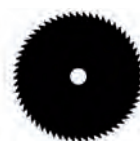
ΔΙΣΚΟΣ ΘΑΜΝΟΚΟΠΤΙΚΟΥ 60Τ 255mm / 1,4mm 11,90€