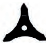
ΔΙΣΚΟΣ ΘΑΜΝΟΚΟΠΤΙΚΟΥ 3Τ 255mm / 3,0mm 10,90€ 3Τ 305mm / 3,0mm 12,90€