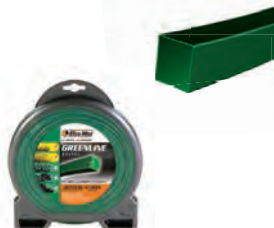
GREENLINE ΤΕΤΡΑΓΩΝΗ Φ3,5mm / 32m BLISTER 14,50€