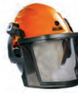
ΠΡΟΣΤΑΤΕΥΤΙΚΟ ΚΡΑΝΟΣ ΕΠΑΓΓΕΛΜΑΤΙΚΟ 89,90€ ΕΡΑΣΙΤΕΧΝΙΚΟ 45,90€